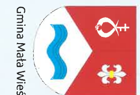
Gmina Mała Wieś