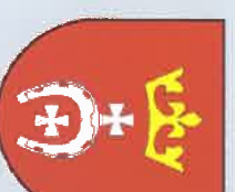
Gmina Stara Biała