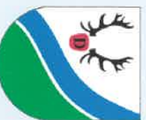
Gmina Nowy Duninów